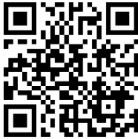
Figura 1: O que é QR Code? 8