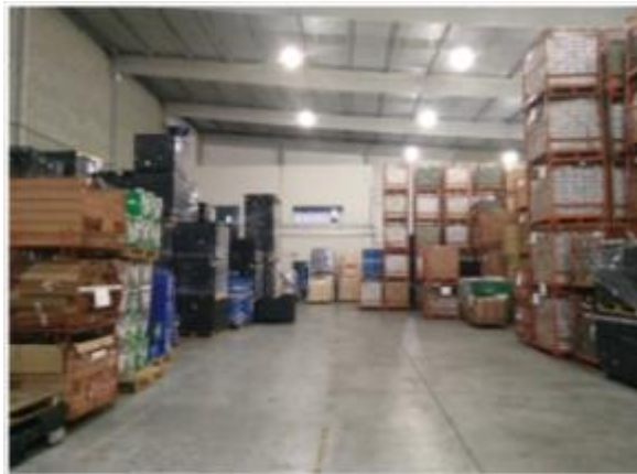
Figura 2 – Área proposta para melhoria