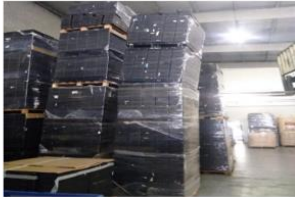
Figura 1 – Forma de armazenamento dos materiais