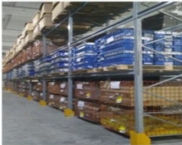
Figura 5 – Estoque após mudança do layout