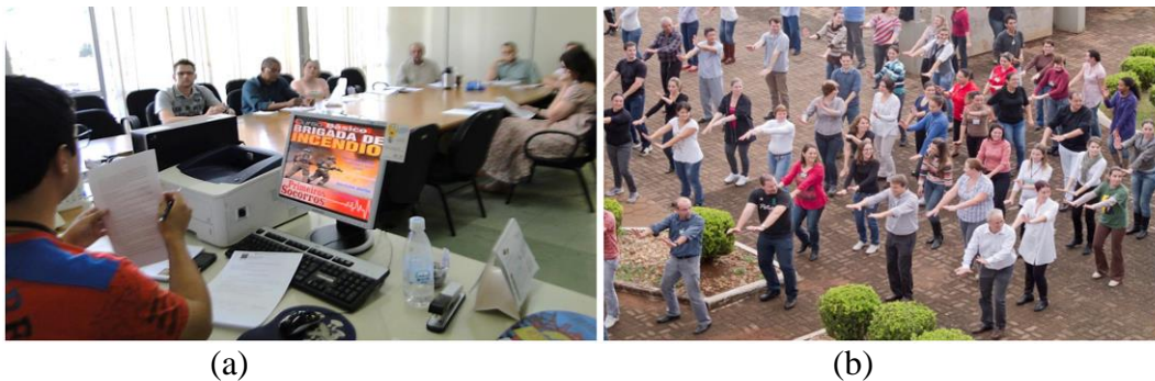
Figura 6 – Atividades realizadas pelos circulistas.

Nota: (a) Reunião sobre a Brigada de Incêndio; (b) Dia do desafio.