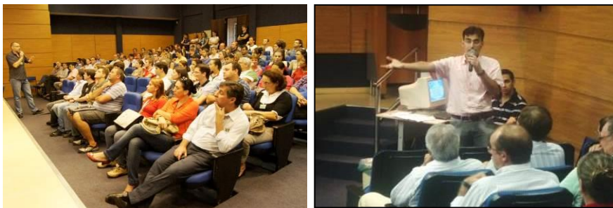
Figura 2 – Reunião com servidores sobre a criação do círculo de controle no Paço

Para a constituição do primeiro círculo decidiu-se fazer uma reunião com os servidores municipais a fim de apresentar o projeto e assim conseguir voluntários para o início do programa. A reunião foi realizada ao final do expediente no anfiteatro localizado no paço municipal, o qual ficou lotado conforme pode ser visto na Figura 2. Depois da apresentação detalhada da proposta fez-se o convite de participação aos funcionários e doze servidores se apresentaram para a formação do primeiro círculo.