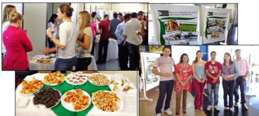
Figura 5 – Dia do trabalho: primeira ação concreta dos circuilistas.

A fim de avaliar na prática o desempenho dos circuilistas foi designado a eles realizar um evento no paço municipal aberto aos funcionários e ao público em geral em comemoração ao Dia do Trabalho. A Figura 5 apresenta algumas fotos desse dia.