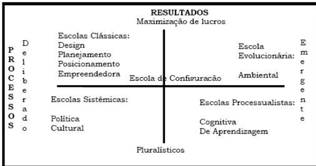
FIGURA 2 – Escolas do pensamento sobre formação estratégica

Gimenez (2000) relaciona as escolas de Mintzberg com o conceito de Whittington em uma estrutura única, conforme mostra a Figura 2.