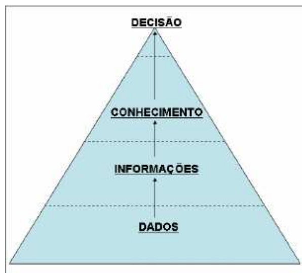
FIGURA 1– Diferentes níveis de dados.

Na figura 1, esta representado o fluxo de como um dado de transforma em uma decisão (diferentes níveis de dados) para melhor entendimento do porque é necessário coletar o dado exato.