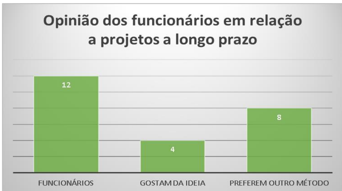
Gráfico 1. Resultado da pesquisa em relação aos projetos a longo prazo.