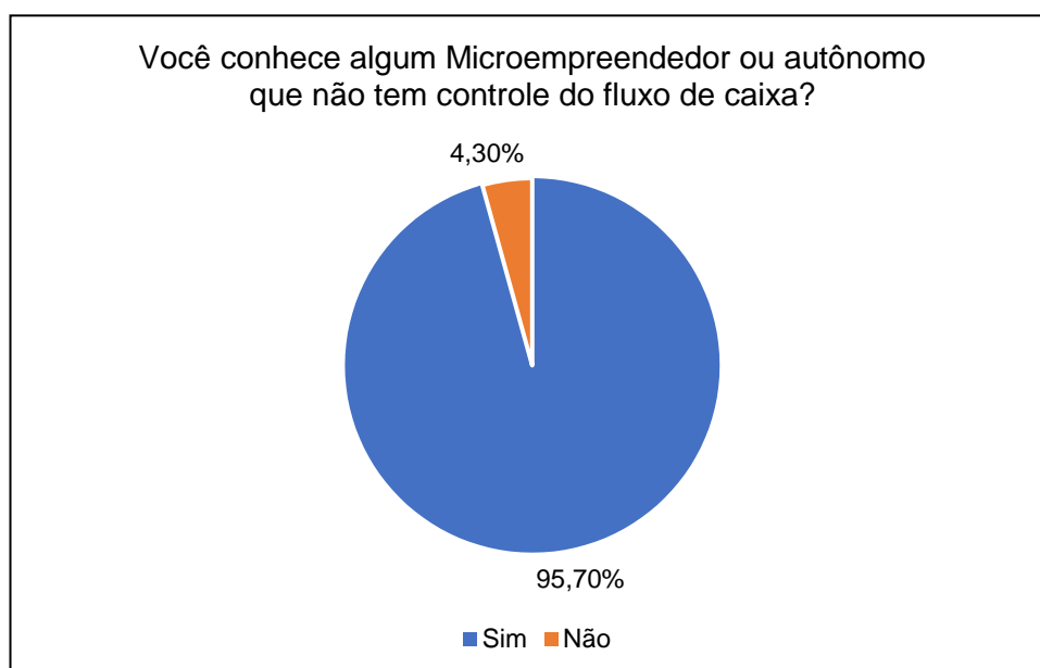
Gráfico 3 – Você conhece algum Microempreendedor ou autônomo que não tem controle do fluxo de caixa?