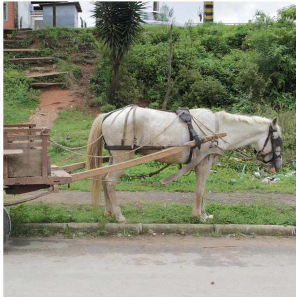
Animal descansa depois de um dia “puxado”