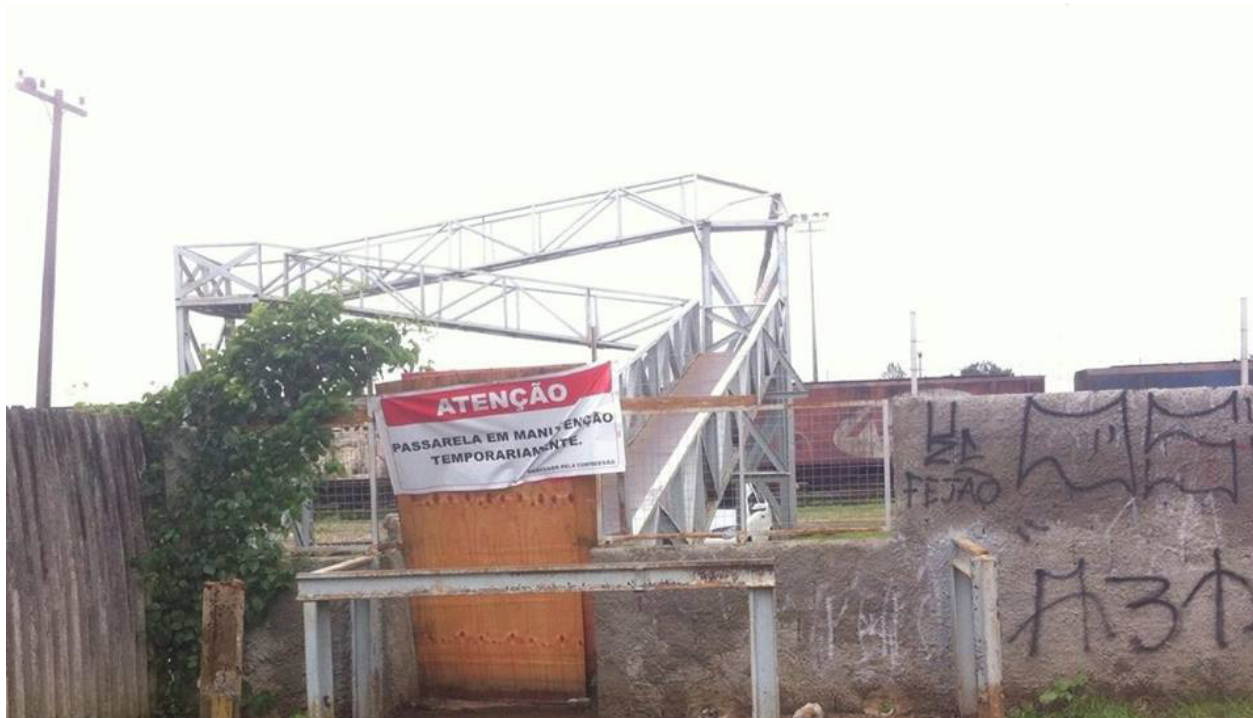
Foto da passarela que foi desativada, mas que já deveria estar em estar em funcionamento, tem causado transtorno aso mordores.

Desde o final de setembro moradores da Vila Pantanal têm que buscar caminhos alternativos para se locomover dentro do bairro Alto Boqueirão, em Curitiba. É que um acidente abalou a estrutura da passarela de 170 metros construída pela América Latina Logística (ALL), prejudicando, assim, cerca de três mil pessoas que utilizam o local todos os dias. Os moradores agora se veem obrigados a percorrer dois quilômetros para transitar em toda a extensão da localidade.