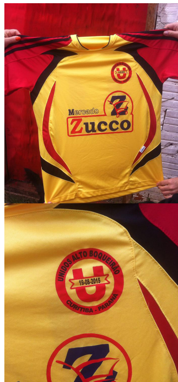
Camisa do time de futebol amador Unidos Alto Boqueirão.