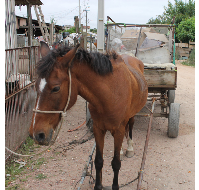
Cavalo cumprindo seu “expediente” diário.