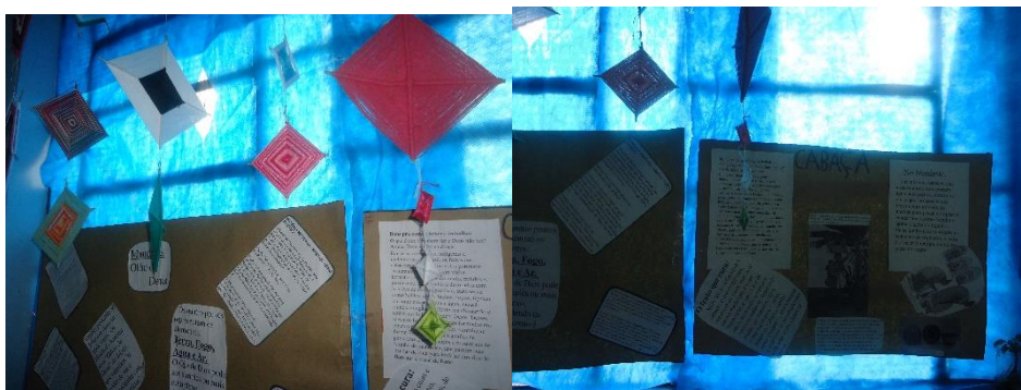
Cartazes história da Mandala “Olho de Deus Ou (Ojo de Dios)” e das cabaças.