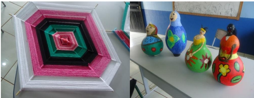
Mandalas feitas com fio de lã, e bonecas pintadas e modeladas com cabaças.