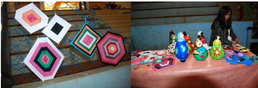
Exposição Semana Pedagógica