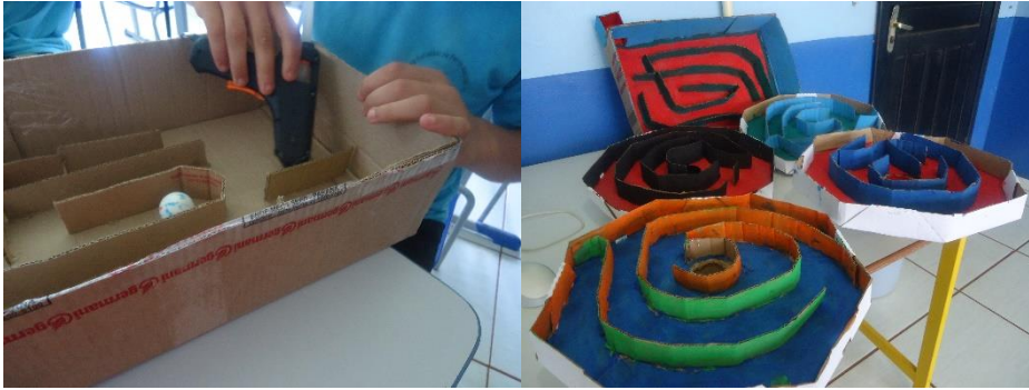
Caixas redondas e quadradas feitas com labirintos.