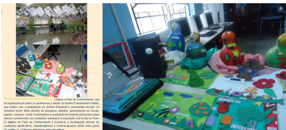
Exposição na escola.