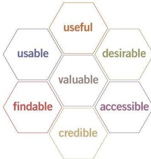
Fig. 2: UX Honeycomb (Liferay, 2020)

Usaremos aqui o exemplo da estrutura do material didático.