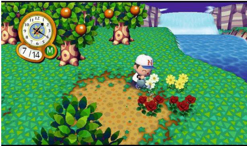
Figura 2: Jogo Animal Crossing