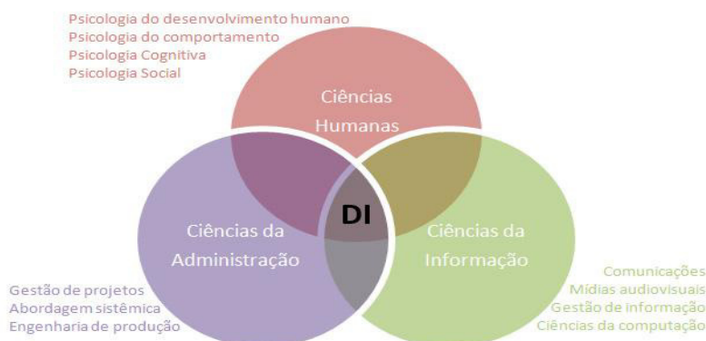
FIGURA 1: CAMPOS DE CONHECIMENTO