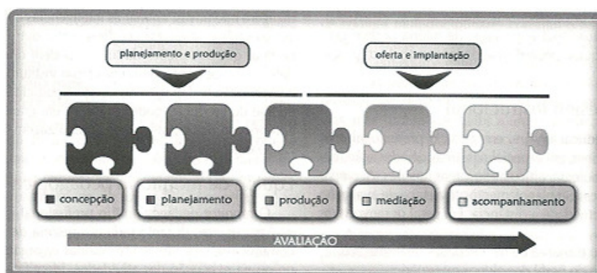
Figura 7 - Fonte: LITTO e FORMIGA (2009, cap.51 p.374)

O projeto pedagógico necessita de profissionais que possam garantir que o material de uma determinada disciplina esteja em plena harmonia. Se a IES onde foi realizado o estudo de caso usar como base a tabela (instrucional) o processo se dará de outra forma: