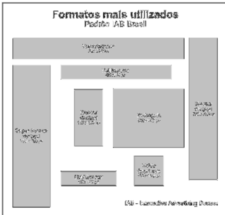
Figura 6 - Formatos para anúncios Internet padrão IAB Brasil 28