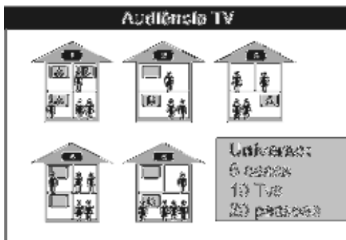
Figura 1 – Audiência domiciliar e individual

Basicamente, podemos dizer, de maneira simples, que a audiência é formada pelo conjunto de pessoas que estão assistindo a um determinado programa. É um número relativo, traduzido em pontos, e pode ser calculado com base em pessoas ou domicílios. Para compreender a diferença entre ambas, observe o gráfico a seguir.