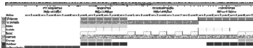
Figura 8 – Exemplo de mapa de continuidade e cronograma geral da campanha